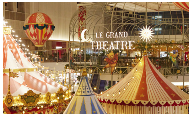
Fairmont Ambassador Seoul