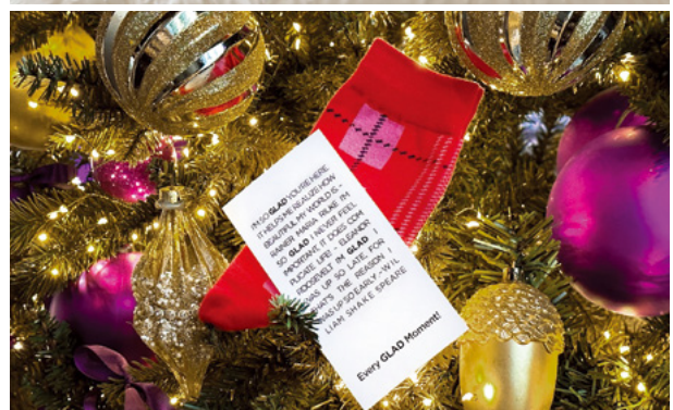
Glad Hotels & Resorts