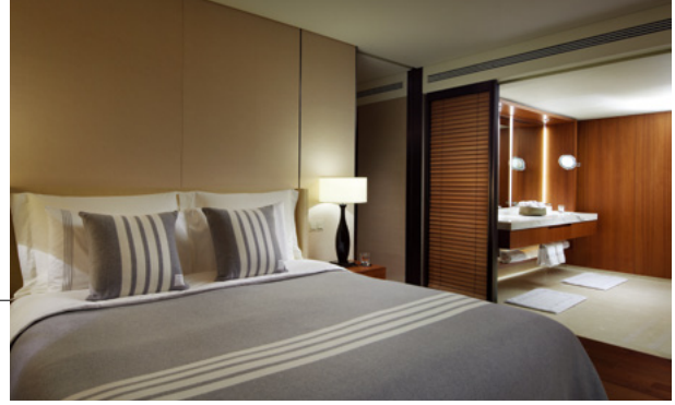
The Shilla Seoul

라이프스타일 큐레이터 글래드 호텔이 따뜻한 크리스마스를 즐길 수 있는 '코지 크리스마스(Cozy Christmas)' 패키지를 2024년 12월 31일까지 선보인다. 서울과 제주의 글래드 호텔 객실 이용 시 크리스마스 무드를 담은 컬러와 패턴의 봉주르마치(Bonjour March) 삭스 2종을 증정하는 이벤트다. ■