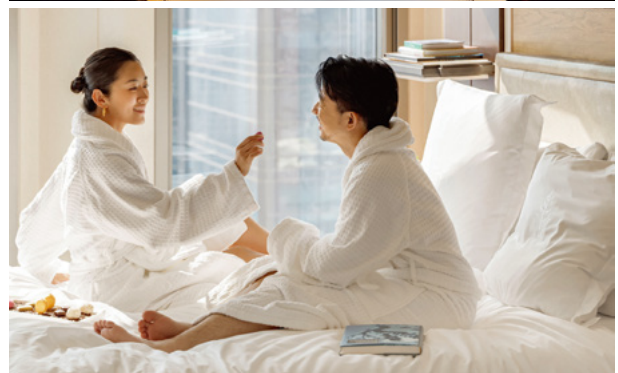
Four Seasons Hotel Seoul