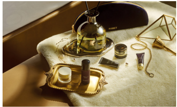
JW Marriot Hotel Seoul